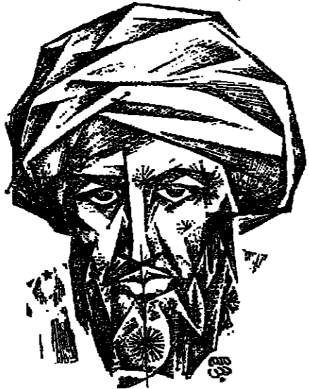
ابن رشد : تلخيص منطق

ويشرحها ويؤيدها ويقدمها للقارئ العربي وللأجنبي أيضا، مطبوعة مشرفة مطبوعة وواضحة. فيلخص لنا في المجلد الأول كتب القياس لارسطو، وفي المجلد الثاني يركز على تلخيصه لخطق ارسطو، فيلخص كتاب البرهان، وكتاب الجدل، وكتاب المغالطة، ليخلص في المجلد الثالث إلى الفوازم والمفاهيم، المنهضة لزمنه للفكرات بين المخطوطات، واخرى لمفسرين الاسماء والمصطلحات، واخر قسم للمصادر والمراجع. هل من جديد قلم الدكتور جهامي لعمارة الفلسفة والمنطق العربي الاتي من اليونان؟ يقول الاب جبر في مقدمته لهذا التحقيق، لقد تحدثت الان احدي رغبات الباحثين في نقل الاورغانون اي كتب الابن، لارسطو إلى اللغة العربية في اوائل القرنين الوسطي على ان كتاب الابن هذا يعني بالذات مجموعة كتب ارسطو في المنطق، ومن ثم عنوان الكتاب الذي هو اليوم بين يدينا «تلخيص منطق ارسطو لابن رشد». الدكتور جهامي، استاذ الدراسات الاسلامية والفلسفة العربية في الجامعة اللبنانية، في مقدمته هذا، حقق لطلاب القلق الفلسفي خطوة في اداء فريضة المنطق والمنطق وفقدان الامل. والتلخيص هذا، نرجو ان يكون منطلقا لاسس جديدة في مفهوم الساميين والفلاسفة التمسسين في هذا الوطن تخدم المنطق والفلسفة لخاص الامسان.